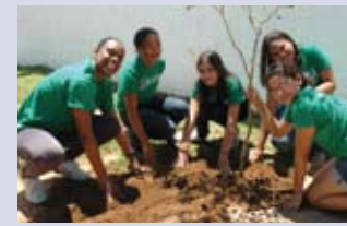
A Comissão de Meio Ambiente também ajudou no plantio

Assim, no dia 21/10 aconteceu o evento festivo, onde toda a escola se mobilizou para plantar flores, árvores, horta e ainda para arborizar a calçada da escola. Foram plantadas muitas mudas de árvores, arbustos e flores: 7 Primavera, 7 Pitanga, 3 palmeiras Areca Bambu, 7 Alpina vermelha, 3 Grumichama, 3 Abriço da Praia, 5 Jerivá, 6 Guanandi, 11 Aroeira Salsa e 3 Ipê Amarelo. Veja o vídeo do evento no site do Clorofila - www.sobloco-canalecolar.ning.com