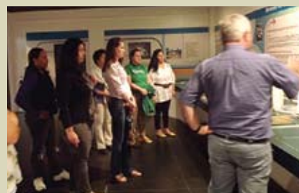
Visita à Exposição Mundo Sustentável da Riviera de São Lourenço

O Curso foi encerrado com a visita dos professores às estações educativas da Riviera