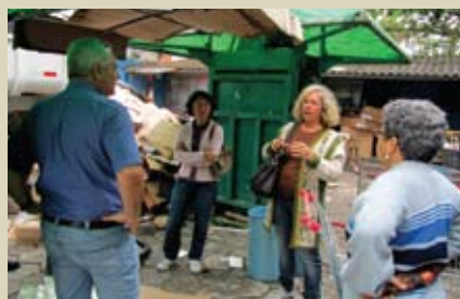
Visita à Central de Triagem de Resíduos