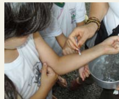
Brincando de tatuagem com tinta natural no braço

Desvendar segredos: como aprender a fazer tatuagem com a tinta natural de um fruto colhido ali mesmo.