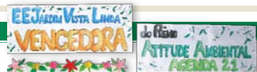
EE Jardim Vista Linda - Alunas da escola posam orgulhosas junto ao painel comemorativo do prêmio conquistado, instalado na escola

A horta será implantada no próprio pátio da sede do Fundo Social, e ocupará um espaço de cerca de 250 metros quadrados.