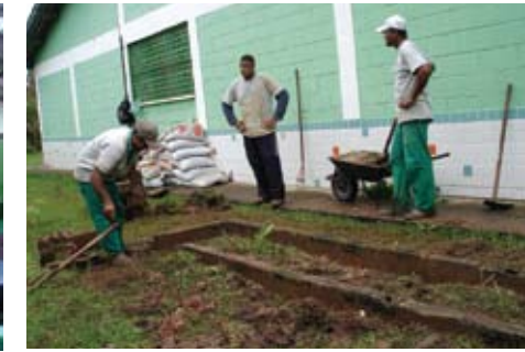
Equipe operacional do Projeto Clorofila efetua a mudança do local da horta escolar, a pedido dos professores que estavam incomodados com a fossa nas proximidades dos canteiros