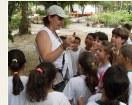
... e mostra novos frutos