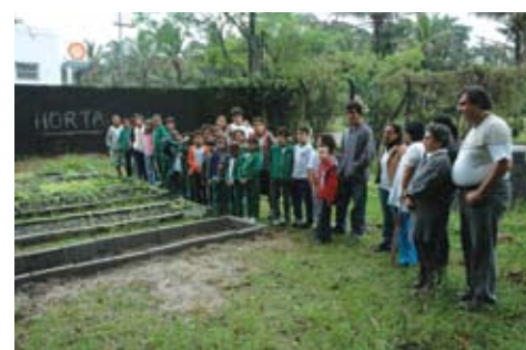
Alunos, professores e diretor visitam a obra de ampliação da horta