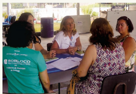
no dia 11 de fevereiro