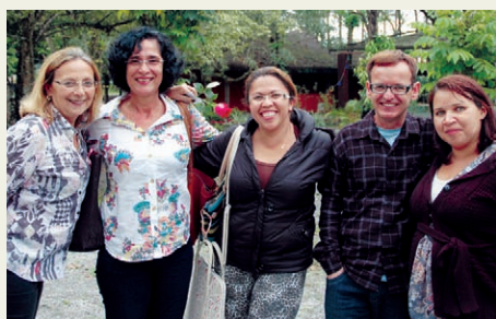
Equipe da EMEF Buzinaro

A Sobloco agradece às escolas vencedoras e ainda à EMEIF Vista Linda, EMEF Giusfredo Santini e EMEIF José Ermírio de Moraes Filho pela participação no concurso.