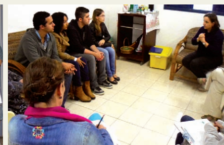
Comissão da EE Armando Belegarde apresentou pessoalmente seu trabalho para os jurados