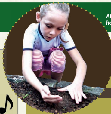
Aluna da EMEIF Mário Covas cuidando da horta, como sempre, com muito carinho