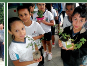
Alunos trouxeram flores de casa para plantar no jardim da escola