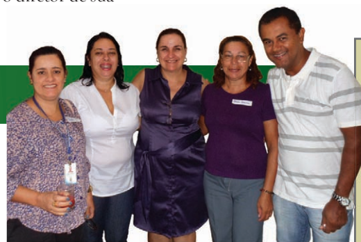
Presença das escolas municipais e estaduais

Encontro anual do Programa Clorofila com gestores da educação fortalece o relacionamento entre todos