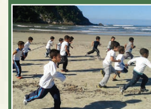
Corrida na praia

Uma semana de atividades bem diversificadas, relacionadas ao meio ambiente, para dentro e fora da escola. Veja só: corrida ecológica na praia, apresentações de paródia do meio ambiente; jogral- planeta amigo; recital de poesia e teatro; confecção e exposição de brinquedos; pesquisa, plantio, preparação de chás e organização de livro sobre ervas medicinais; caminhada pelo bairro chamando atenção de todos para a importância do dia e do tema; feira de livros usados para troca entre alunos e a comunidade; criação de um canteiro com flores trazidas da casa dos alunos.