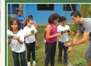
Formando um canteiro com flores de casa