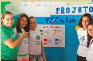
Lançamento do Projeto Escola Limpa