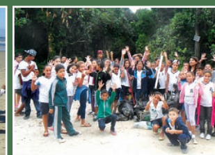
Atividades ao ar livre