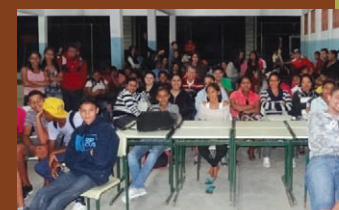
Platéia do concurso de vídeo