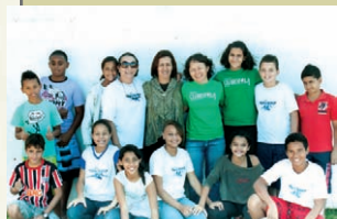
Um esforço coletivo