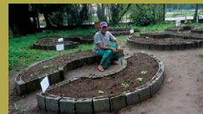
Nova horta muito mais charmosa

Um passeio ciclístico para observar a natureza, jogos cooperativos, confecção de brinquedos, sucos diferentes e inauguração da nova horta da escola, marcaram o dia do meio ambiente.