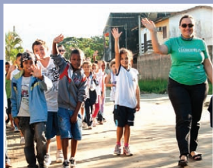
Trabalho com alegria