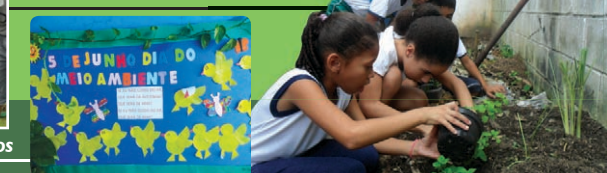
Cartaz feito pelos alunos