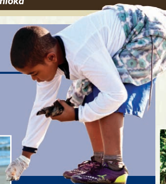
Cada um faz sua parte: aluno recolhe o lixo da praia