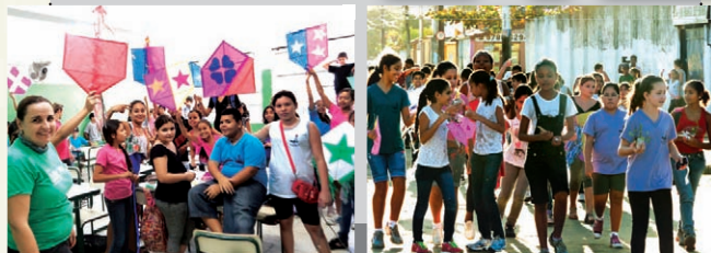
Preparando pipas para revoada na praia