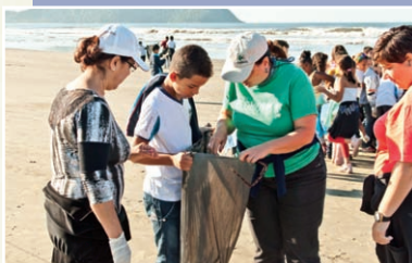
Educadoras orientam e incentivam os alunos

“Os pequeninos da escola a praia, onde organizaram um mutirão de limpeza, dando exemplo de cuidados com o ambiente a todos os moradores