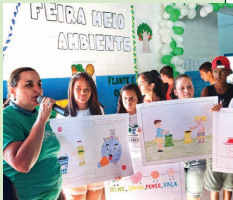
Lançamento oficial do Projeto Escola Limpa

Parabéns às alunas protagonistas de mudanças em sua escola e à direção, pelo apoio que vem dando ao projeto. Para o Programa Clorofila, é um orgulho reconhecer esses frutos de seu trabalho.