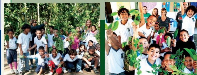
Valorizando o conhecimento dos antepassados sobre as plantas que curam

Coleta e identificação de plantas que curam, no entorno da escola.