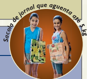
Sacola de jornal que aguenta até 5 kg