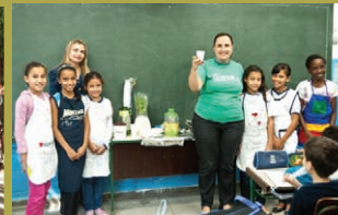
Sucos muito especiais... hum!!!