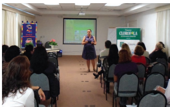
Encontro de parceiros

Este ano o Encontro de Parceiros aconteceu dia 21 de março e nele pode-se conhecer melhor o trabalho de cada escola ali presente e iniciar o ano com os laços de parceria fortalecidos.