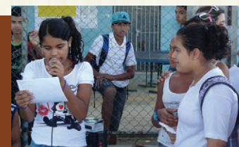
Concurso de rap