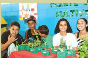
Venda de mudas de temperos