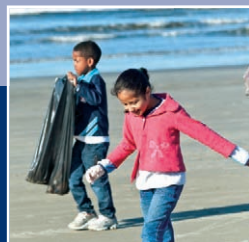
A praia é também o nosso meio ambiente