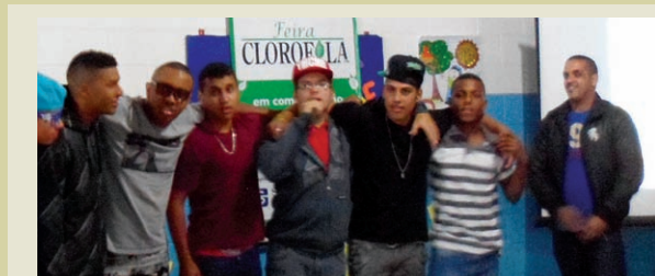
Grupo vencedor do concurso de rap, com o tema "Meio Ambiente"

Temos que usar o "r" de reciclar Pra poder viver, reduzir e reutilizar Pra poder viver (2 x)