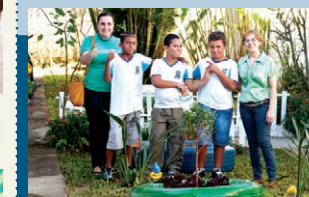
Nova cara ao jardim da escola

Com a presença de muitos pais e técnicos das secretarias de educação e do meio ambiente, a escola organizou uma feira com grande diversidade de ações inspiradoras: canto coral, sabão caseiro, livros educativos, artesanato com reaproveitamento de caixas de suco e retalhos, culinária sustentável e até a "mosquitérica", uma armadilha contra o mosquito da dengue.