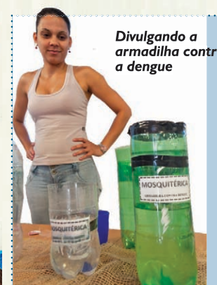
Divulgando a armadilha contra a dengue