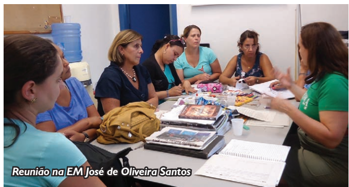
Reunião na EM José de Oliveira Santos

O contato pessoal com cada escola parceira estreita os laços do Programa, incentiva a participação e fortalece o protagonismo