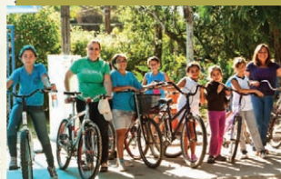
Passeio Ciclístico de Observação da Natureza