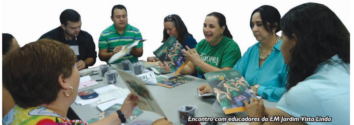
Encontro com educadores da EM Jardim Vista Linda

Tanta coisa já fizemos neste semestre, que até parece estranho falar do começo do ano. Mesmo assim, a equipe do Programa Clorofila fez questão de ir pessoalmente a cada escola parceira, para apresentar e discutir com professores, coordenadores e diretores seu plano de ação anual.