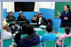
Palestra para o período noturno EJA sobre lixo e qualidade de vida