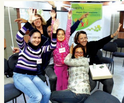
O curso favorece também a integração de educadores de diferentes escolas