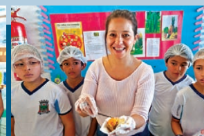
Degustação no estande de culinária sustentável