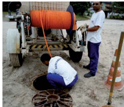
LIMPEZA preventiva da rede coletora de esgotos