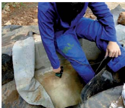
REPAROS em canaletas das lagoas da ETE