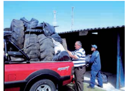
DESTINAÇÃO adequada de pneus