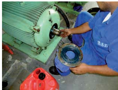
MANUTENÇÃO preventiva nas bombas da Estação de Tratamento de Água (ETA)