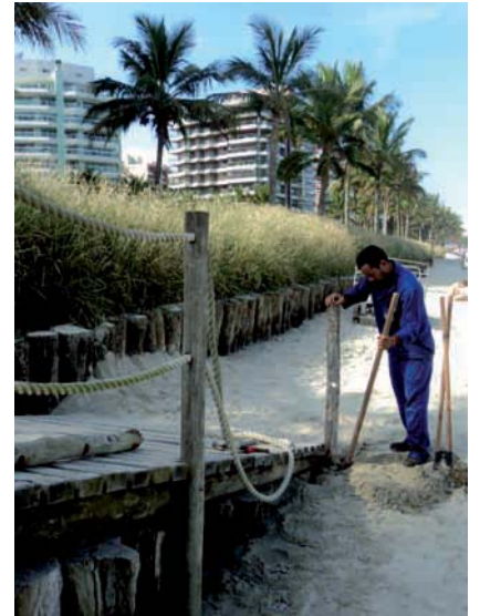
REPARO em guarda-corpo de passarela de acesso à praia