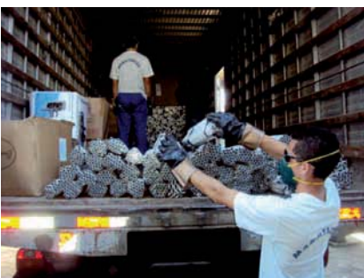
DESTINAÇÃO adequada de lâmpadas fluorescentes