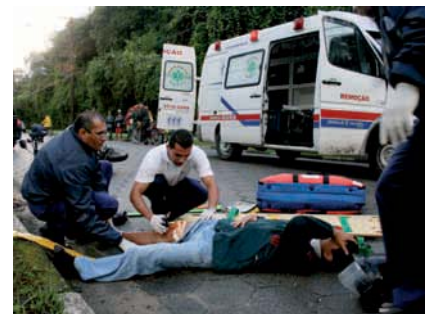
TREINAMENTO de atendimento a urgências