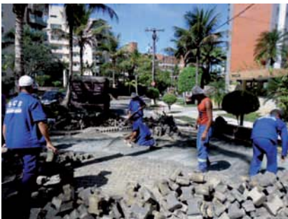
REFORMA em lajes de poços de visita na rede de esgoto e no pavimento (Módulo 4)