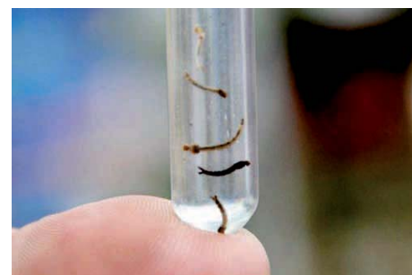
LARVAS do mosquito Aedes aegypti encontradas em todo o País

RIVIERA também irá selecionar e treinar estagiários (estudantes de biologia e técnicos em Meio Ambiente), para a Campanha de Prevenção da Dengue. Aproveitando o período de maior ocupação dos imóveis da Riviera, serão realizadas vistorias nas áreas externas dos imóveis, para orientação aos proprietários e ou prestadores de serviços para que colaborem com a eliminação de criadouros do Aedes aegypti .