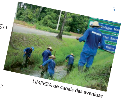
LIMPEZA de canais das avenidas

P ara suporte ao Sistema de Gestão Ambiental (SGA) e à manutenção da infraestrutura da Riviera de São Lourenço, a ASSOCIAÇÃO DOS AMIGOS DA RIVIERA mantém programas de treinamento para todos os seus funcionários. Atualmente eles são mais de 500, distribuídos nos setores de Administração, Manutenção, Saneamento e Segurança. A lista de serviços e obras a cargo da ASSOCIAÇÃO é extensa. A partir desta edição, apresentamos um resumo daqueles executados no último período.