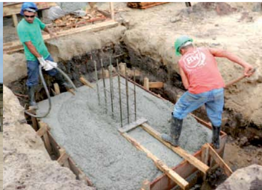
INÍCIO das obras de ampliação da sede da Associação Amigos da Riviera, no Módulo 26