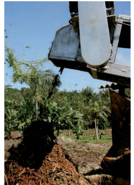
COLETA e trituração de resíduos vegetais