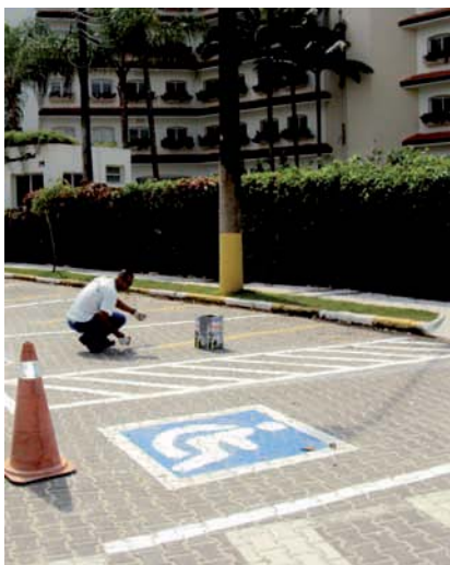
DEMARCAÇÃO de vagas especiais de estacionamento