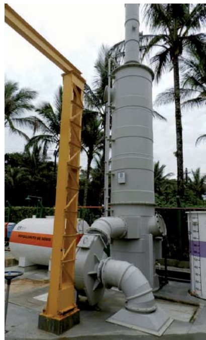
MELHORIAS no lavador de gases da Estação Elevatória de Esgoto