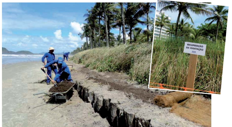
RECUPERAÇÃO da vegetação na parte superior da praia, em áreas afetadas pelas ressacas