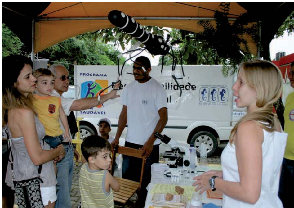
CAMPANHA permanente de prevenção a dengue, promovida pela Associação, orienta moradores

O aumento do número de casos de dengue tipo 4, registrados este ano, indica um risco real de epidemia da doença no próximo verão. O alerta partiu de autoridades de saúde que estiveram reunidas no 18º Congresso Internacional de Medicina Tropical e Malária, realizado de 23 a 27 de setembro, no Rio de Janeiro.