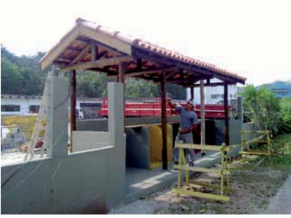
RECONSTRUÇÃO de posto para lixo reciclável, no Módulo 26