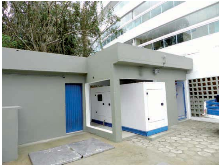
INSTALAÇÃO de cabines para confinamento de geradores