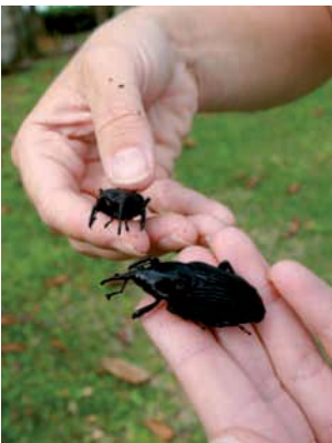
CONTROLE da broca-do-olho-do-coqueiro