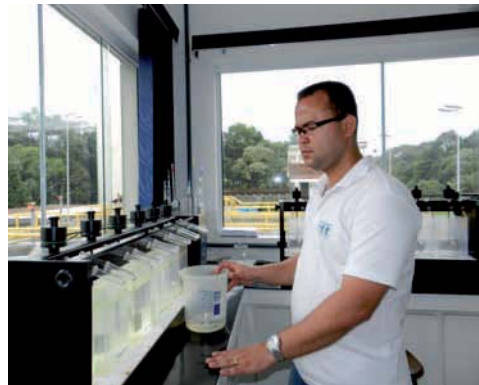
REFORMA na Estação de Tratamento de Água (ETA) com ampliação do laboratório e de salas controle operacionais