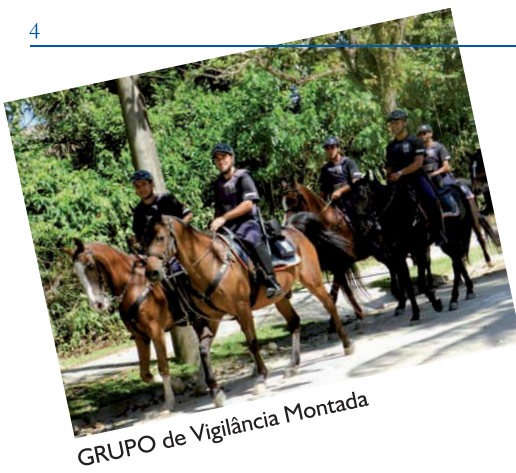
GRUPO de Vigilância Montada