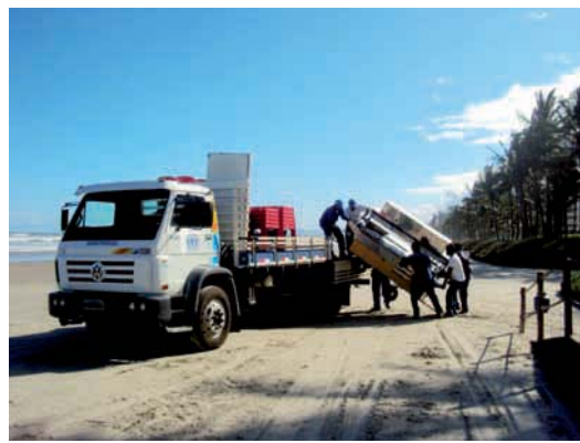
REMOÇÃO de carrinhos de ambulantes deixados sobre o jundú: auxílio à Prefeitura