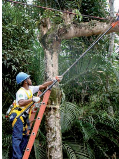
PODAS de formação, no Módulo 3