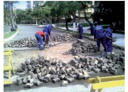
REFORMA de sarjeta e pavimentação no Módulo 2