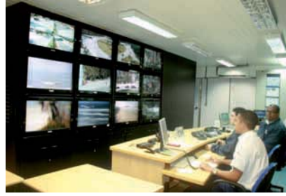
VIDEOMONITORAMENTO 24 horas