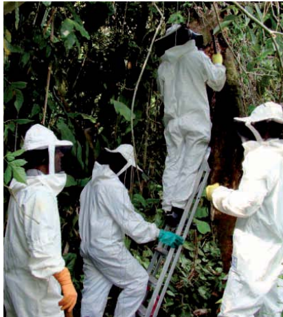
REMOÇÃO de enxame de abelhas