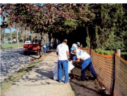
VARRIÇÃO de folhas secas nas avenidas