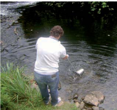
COLETA de água no Rio Itapanhá para análise