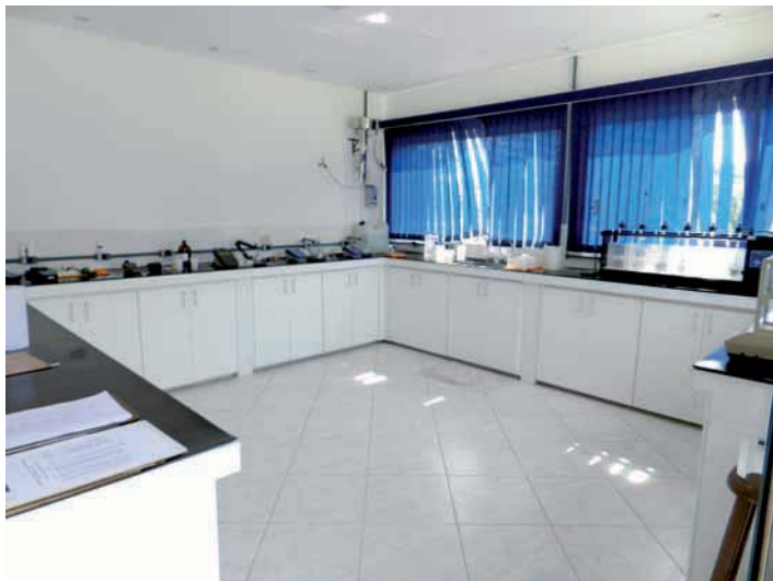
REFORMA e manutenção da Estação de Tratamento de Água (ETA)