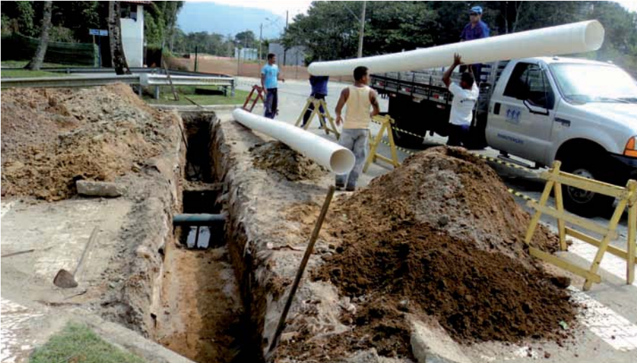
CONSTRUÇÃO de galeria no Módulo 4 (Av. Orla, esquina com a Passeio da Pousada)