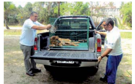
ENCAMINHAMENTO de animais de rua para tratamento