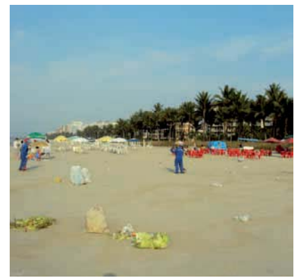
LIMPEZA diária da praia