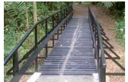
MANUTENÇÃO na área de despejo de efluentes tratados