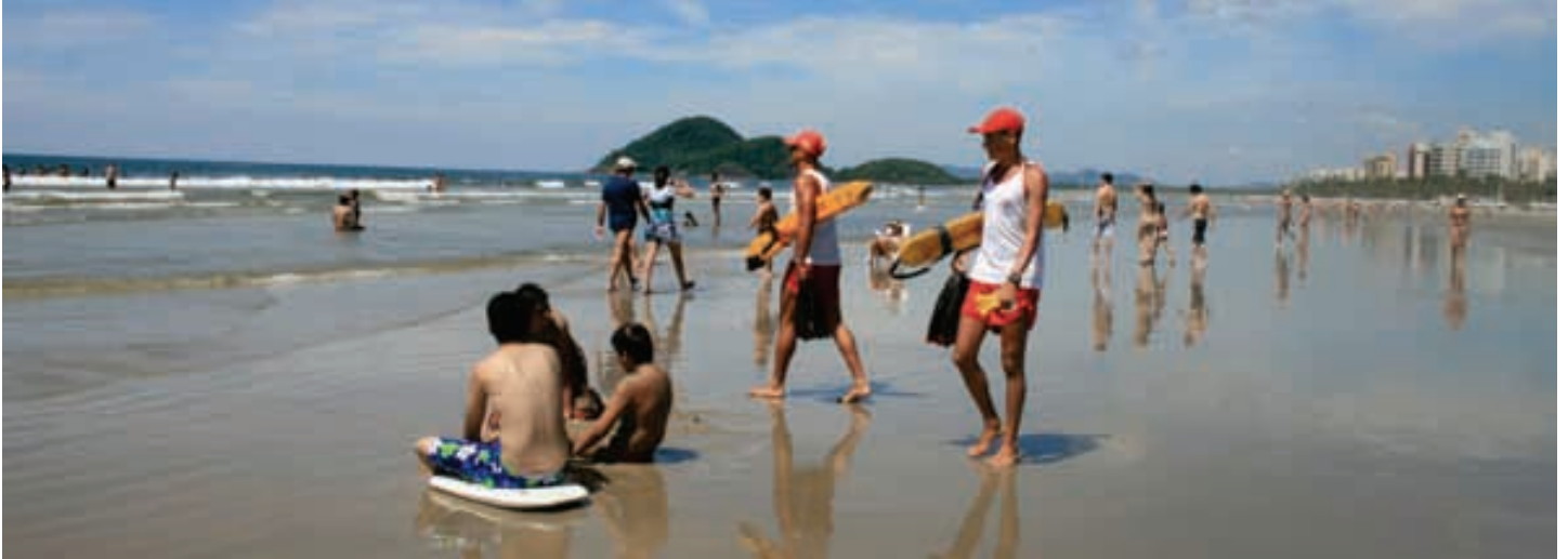
Guarda-vidas da AARSL atuam em colaboração com os Bombeiros, em operações de resgate, salvamento e prevenção.