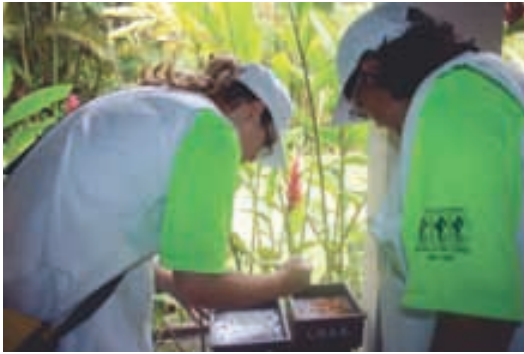
Agentes da Campanha de prevenção à dengue, da Associação dos Amigos da Riviera, em vistoria nas áreas externas dos imóveis, orientam moradores

A proveitando o período de grande ocupação dos imóveis na Riviera, durante a temporada, estagiários treinados pelo setor de Meio Ambiente da ASSOCIAÇÃO DOS AMIGOS, vistoriaram imóveis (áreas externas), em todos os Módulos, para conscientizar e reforçar as orientações sobre os cuidados necessários à eliminação de possíveis criadouros do Aedes aegypti - vetor da dengue.