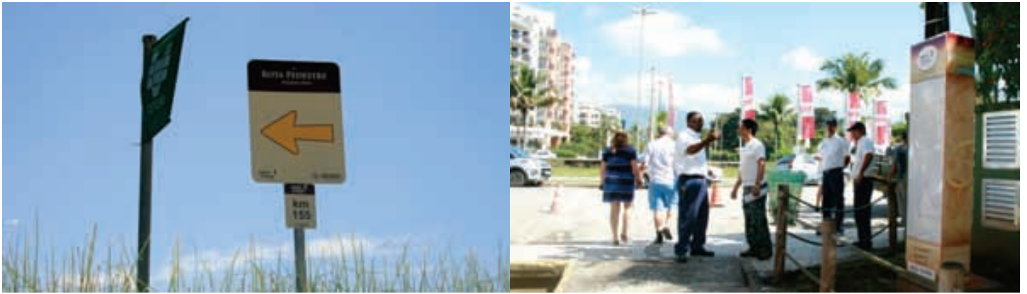
DO FORTE São João de Bertioiga, caminhantes seguem pela praia encontrando na Riviera de São Lourenço um dos totens dos peregrinos

A rota turística lançada pelo Governo do Estado é considerada caminho de peregrinação e contemplação pelo litoral paulista, que vai de Peruíbe a Ubatuba. Em Bertioiga, os caminhantes encontram pórticos no Forte São João e na Riviera de São Lourenço.