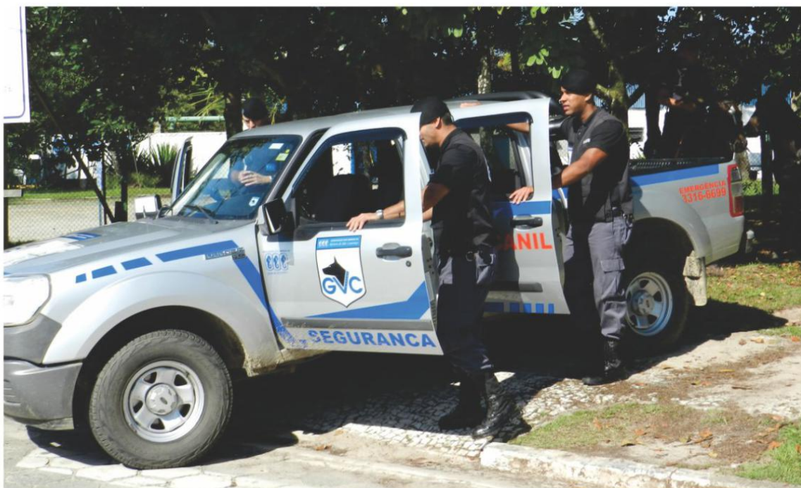
Em atendimento à nova legislação trabalhista, Associação enxuga gastos em todas suas atividades e serviços