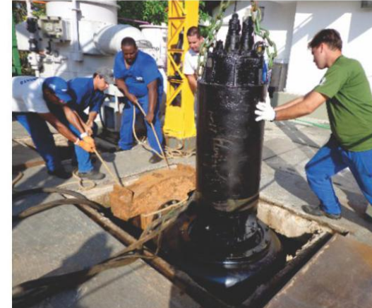
Manutenção em equipamento da Estação Elevatória de Tratamento de Esgoto