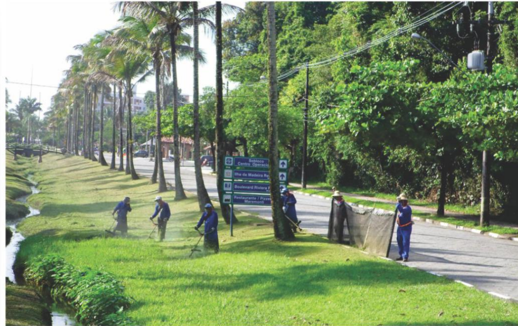
Roçadas de praças e canais de drenagem

Diversos outros serviços, obras e melhorias foram realizadas pela ASSOCIAÇÃO DOS AMIGOS, nos meses de janeiro e fevereiro, e parte deles podem ser conferidos a seguir.