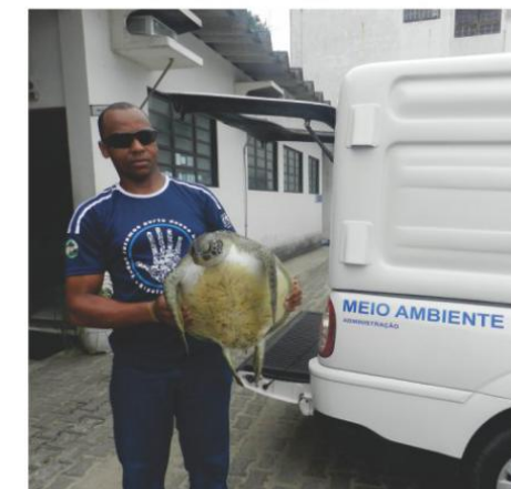
Resgate de animais marinhos