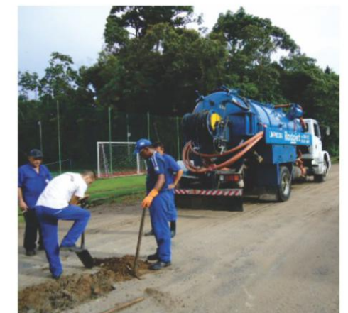
Desobstrução em rede de esgoto