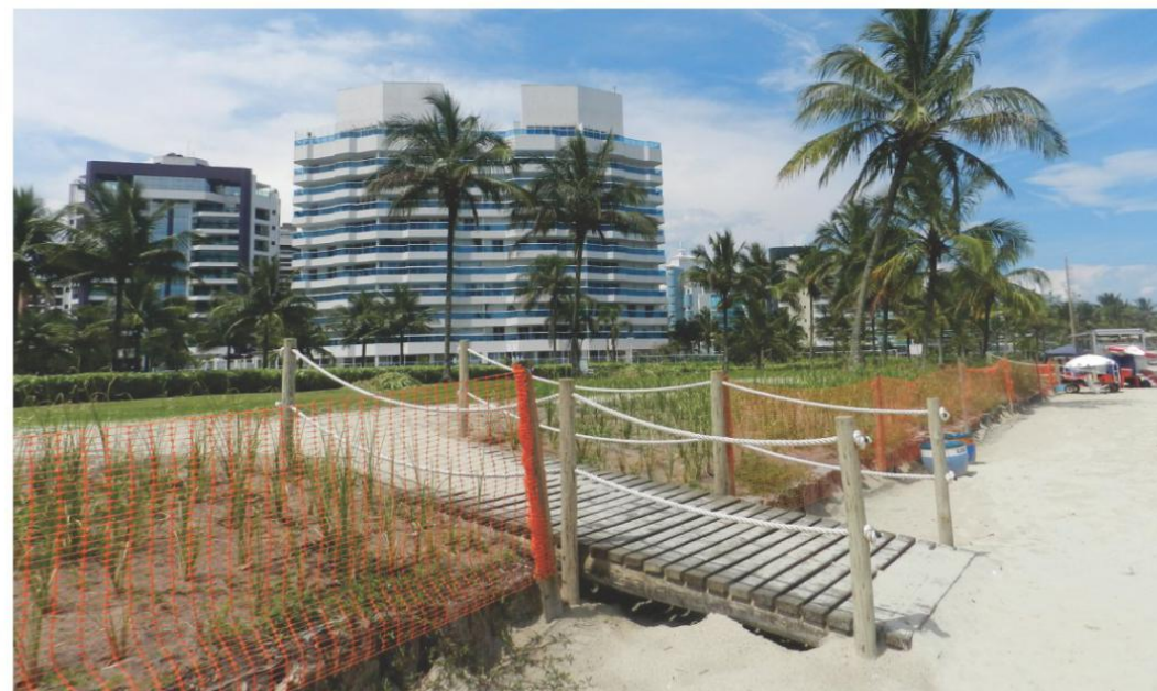
Construção de rampas de acesso em obra de restauração da parte superior da praia (Módulos 6 ao 8)