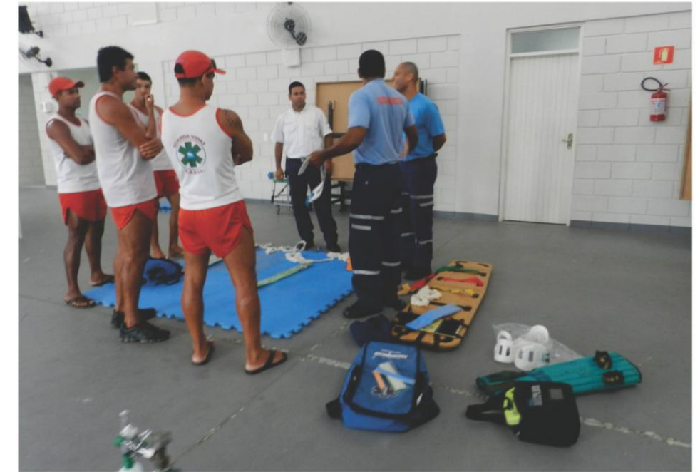
Treinamento de guarda-vidas e socorristas, no salão multiuso da sede da Associação