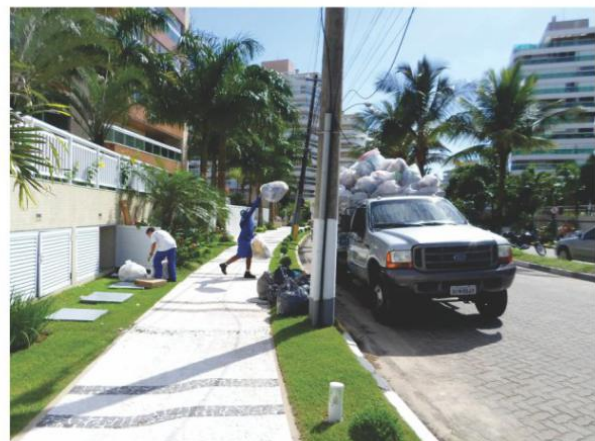
Coleta Seletiva nos edifícios, comércios e Postos de Entrega Voluntária (PEVs)