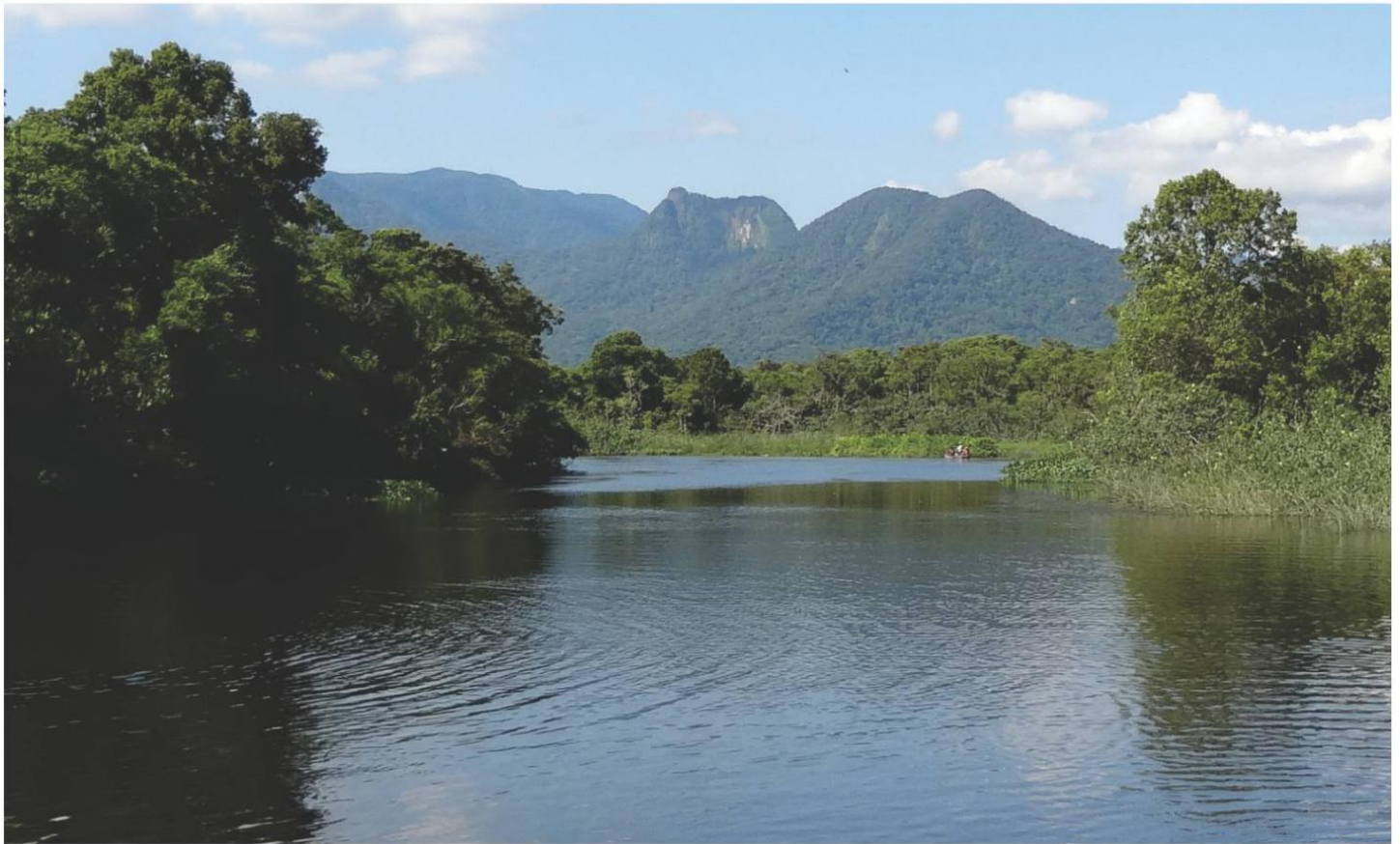
Rio Itapanhaú: manancial de captação de água para tratamento e abastecimento na Riviera