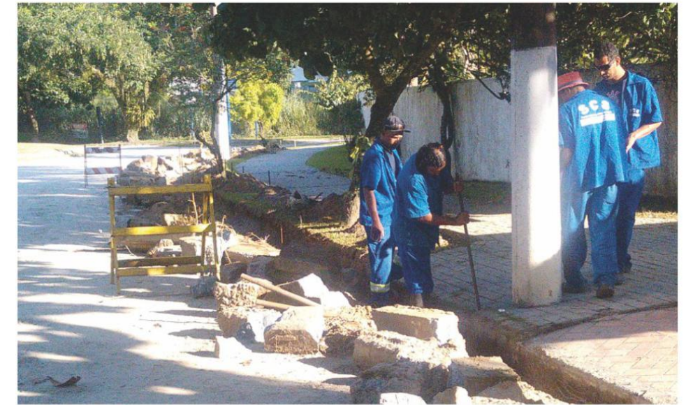
Reparos em guias e sarjetas