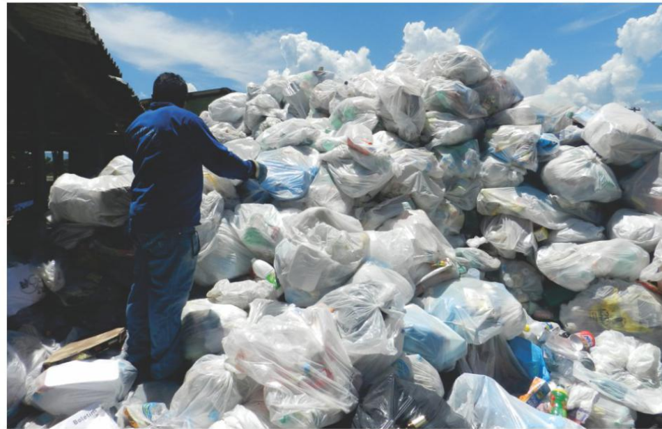
Resíduos recicláveis: seleção, armazenamento e destinação