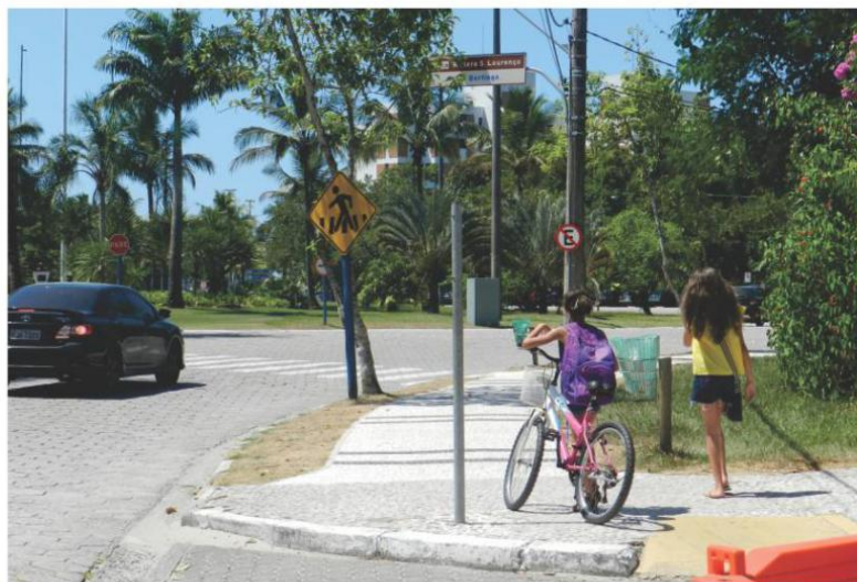
Calçadas em áreas públicas são conservadas pela Associação dos Amigos