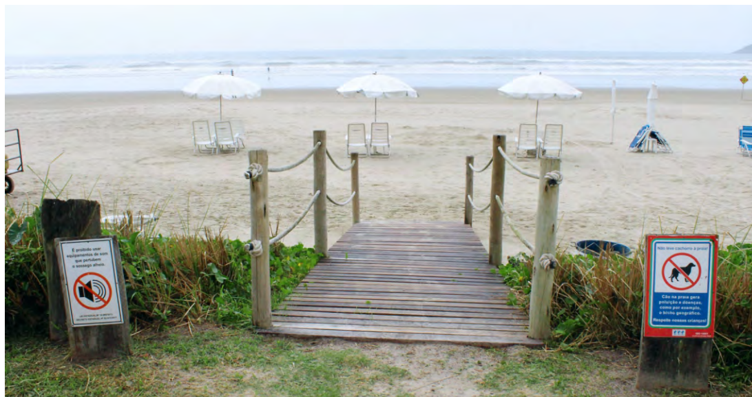
Sinalizações nos acessos à praia alertam para proibição de equipamentos de som que perturbem o sossego

Poluição sonora é crime (artigo 54 da Lei de Crimes Ambientais (9605/98)). Em Bertiooga, a prática ainda pode resultar em multas com valor superior a seis mil reais; a lei municipal 1.101/14 considera dois tipos de emissão sonora: a fixa, de aparelho instalado em imóvel residencial ou comercial, e a móvel, como caixas de som portáteis