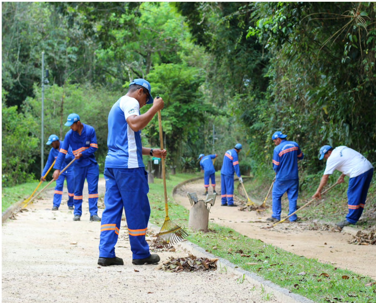
Associação dos Amigos zela pela conservação da Riviera, com time de mais de 120 funcionários no Setor de Manutenção

Para manter a qualidade dos serviços que asseguram a conservação da infraestrutura urbana da Riviera, o tratamento da água para abastecimento em todos os imóveis, a vigilância nas áreas públicas, entre outros serviços, a ASSOCIAÇÃO DOS AMIGOS DA RIVIERA reforçou o quadro de funcionários, e renovou veículos e equipamentos necessários aos serviços e atividades desempenhadas pelo Serviço de Segurança, e setores de Manutenção, Meio Ambiente, e Saneamento.