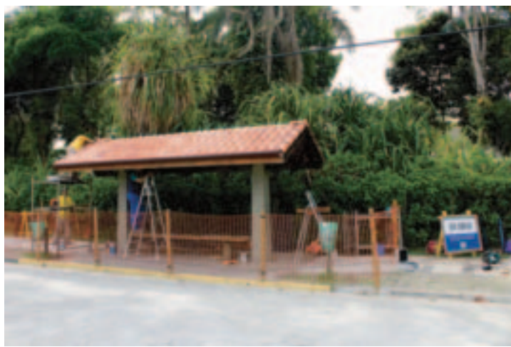
Construção e conservação de abrigos de ônibus