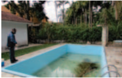
Piscinas sem tratamento: vistoriadas semanalmente e cloradas pelo Setor de Meio Ambiente, para evitar a proliferação do mosquito Aedes aegypti