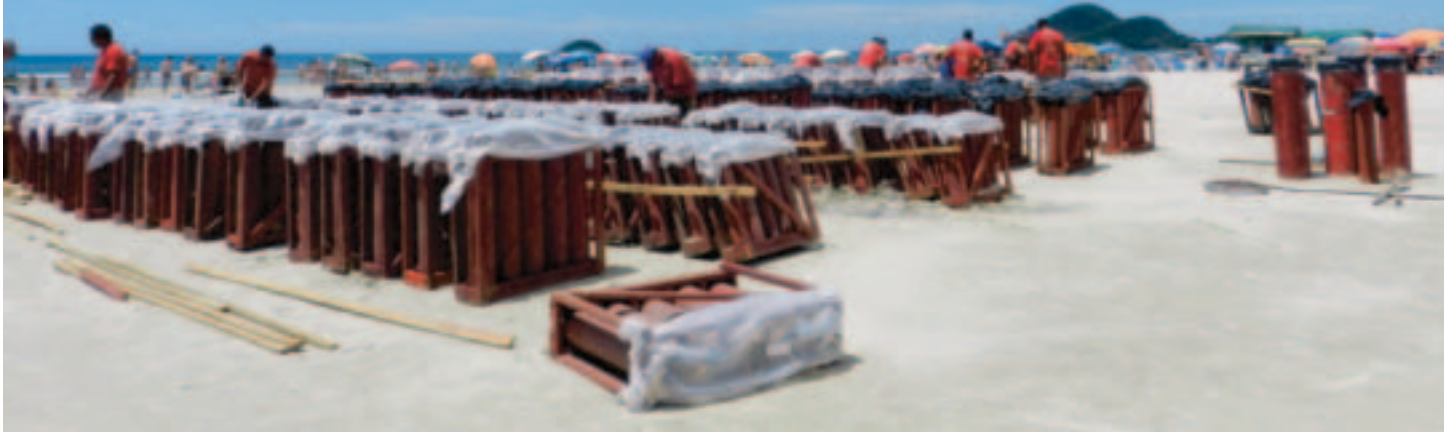
Sincronização na detonação de fogos e equipamentos acionados eletronicamente, por técnico habilitado para o tipo de evento

A virada de ano em diferentes pontos do Brasil é momento de festa, com shows pirotécnicos e atrações musicais. Em Bertioga, também é assim e, na Riviera de São Lourenço, milhares de pessoas são esperadas para a tradicional queima de fogos de artifício promovida pela ASSOCIAÇÃO DOS AMIGOS DA RIVIERA em conjunto com a Sobloco Construtora.