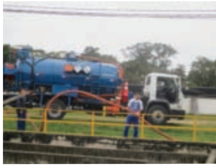
Remoção do lodo e limpeza da câmara de contato de cloro da ETE