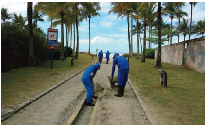
Remoção de areia da praia, acumulada devido às ressacas