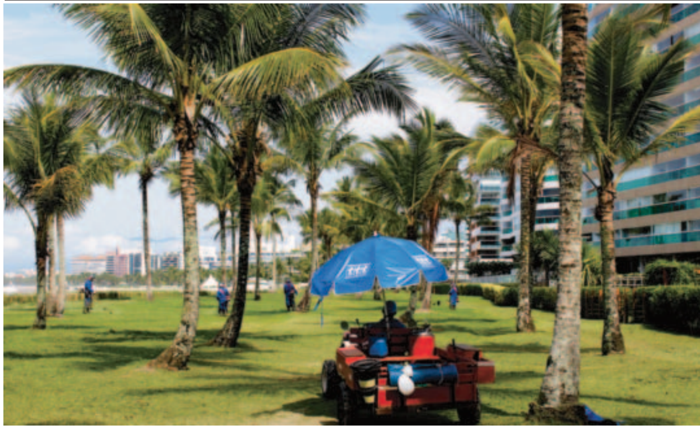
Conservação da infraestrutura da Riviera é garantida com serviços diários da Associação dos Amigos