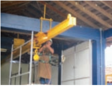
Manutenção da monovia em instalações da ETE