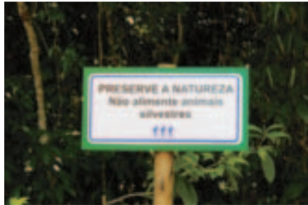
Instaladas mais 25 placas de orientação para preservação da Natureza