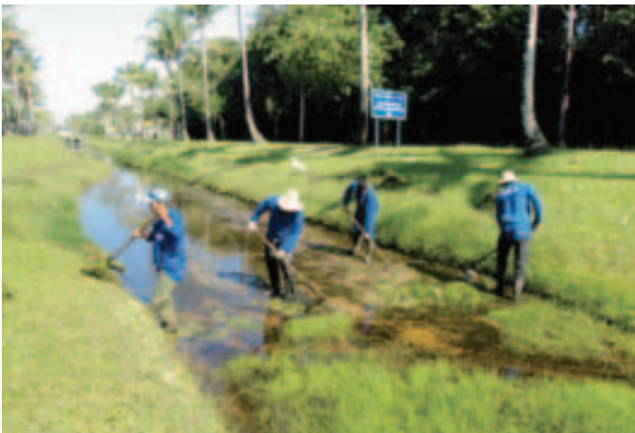
Manutenção em canais, caixas de drenagem, passagens de pedestres e vias públicas