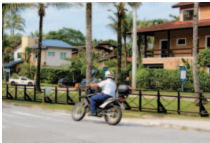
Ronda diária de vigilantes do Serviço de Segurança.

Desde a temporada passada, bicicletários públicos instalados pela ASSOCIAÇÃO DOS AMIGOS, nas praças da Orla e São Lourenço tem efetivo uso diário, por trabalhadores que utilizam bicicletas para deslocamento de suas residências, localizadas em diferentes bairros de Bertioga, aos locais de trabalho e aos pontos de ônibus urbanos, na Riviera. Um novo bicicletário está em instalação, próximo ao novo trecho de calçada e ciclovia (fundos do Shopping), e pronto para uso no início da temporada de verão.