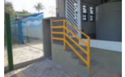
Construção de abrigo para tanque de gás na Estação de Tratamento de Água