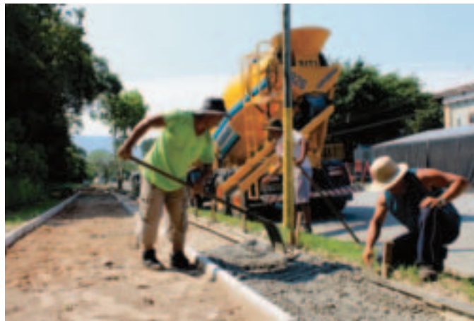
Al. Boa Vista: construção de 687 m lineares de calçadas e ciclovia

da entre as ruas Passeio das Garaúnas e Passeio Tipuana, na Av. São Lourenço, somando mais 619 metros lineares em continuidade de equipamentos (calçadas e ciclovias) existentes nos Módulos 18 e 20 e parte do 22. Recentemente, a