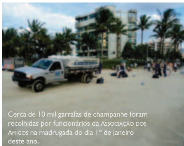
Cerca de 10 mil garrafas de champanhe foram recolhidas por funcionários da ASSOCIAÇÃO DOS AMIGOS na madrugada do dia 1º de janeiro deste ano.

prevenir acidentes. Com as devidas autorizações, a montagem dos fogos será iniciada logo na manhã do dia 31 de dezembro, pela equipe da empresa contratada e responsável pela avaliação do local, montagem e execução do show pirotécnico.