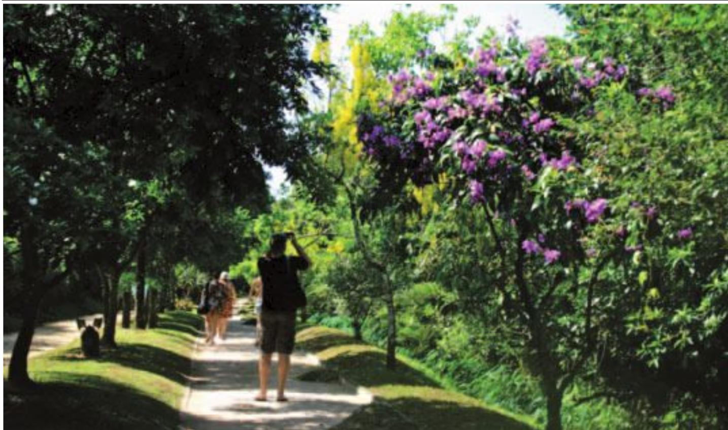
Natureza preservada e infraestrutura da Riviera são atrativos permanentes para moradores e frequentadores