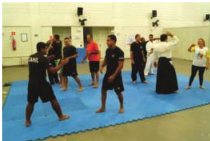
Aprendizagem de técnicas de defesa pessoal