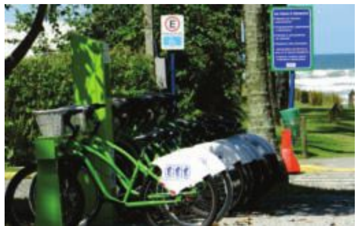
Bicicletas compartilhadas passam por manutenção periódica