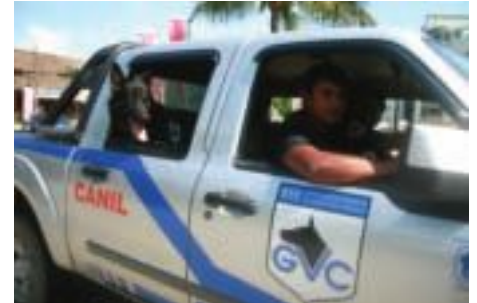
Cães treinados no Serviço de Vigilância