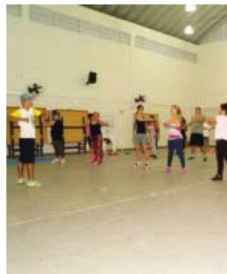
Incentivo às práticas esportivas