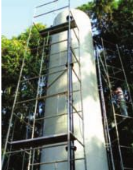
Demolição e reconstrução da torre de carga do Módulo 28