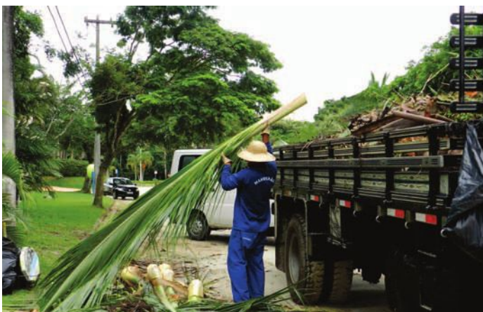
Coleta de resíduos vegetais