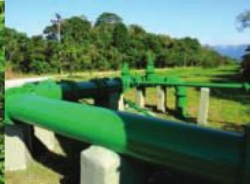
Pintura na (rede) linha de água bruta na EBAR e na entrada da ETE