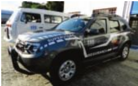
Aquisição de veículo para uso no serviço de Segurança