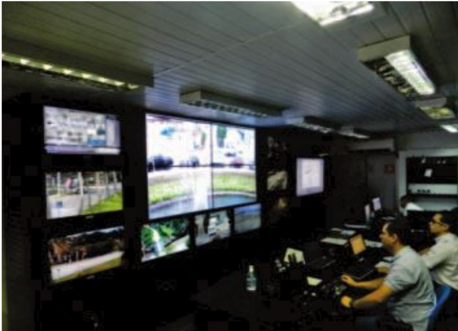
Sistema de videomonitoramento conta com mais de 100 câmeras em operação

Os cuidados de cada morador, na proteção do patrimônio pa melhor prestação dos serviços da ASSOCIAÇÃO em auxílio às polícias e coop