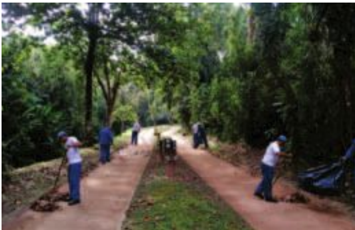
Manutenção das ciclovias