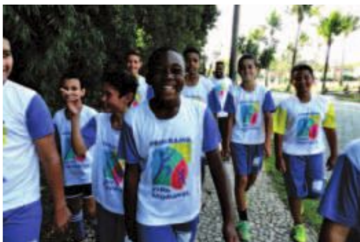
Oficinas de esportes e artes atendem público infanto-juvenil

Para saber mais e participar das atividades do Vida Saudável basta entrar em contato pelo telefone 33195000 ramal 5049 ou comparecer à sede da ASSOCIAÇÃO DOS AMIGOS, de segunda a sexta-feira, das 8h às 16h30.