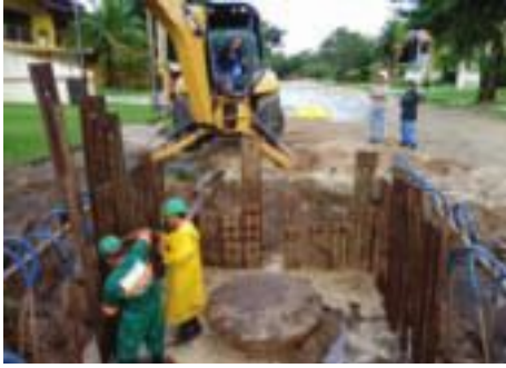
Reconstrução de poço de vista de esgoto